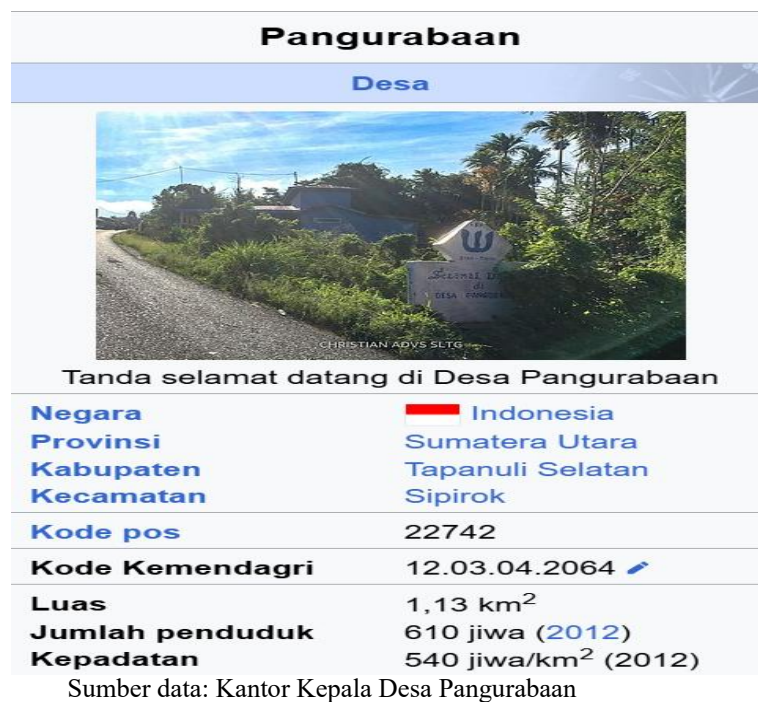
Gambar 4.1 Gambaran Lokasi Desa Pangurabaan