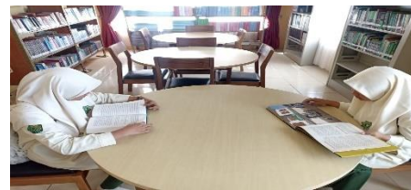
Anak SMA yang Berkunjung

Sumber: Perpustakaan Prof Drs Lafran Pane