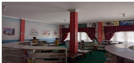
Anak SD yang Berkunjung