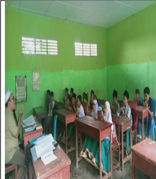
Doa bersama sebelum pembelajaran