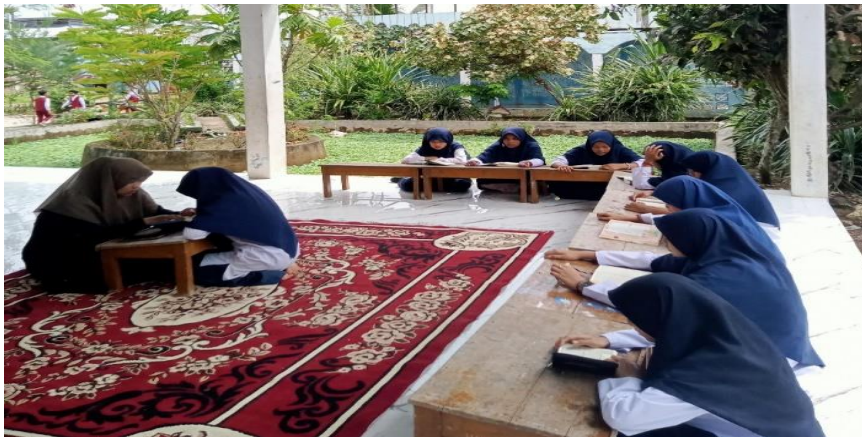
2. Suasana saat belajar di luar kelas