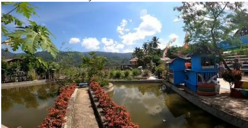
3. Suasana taman dan kolam di SMP IT Al-Hijrah Bintuju