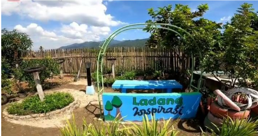
1. Suasana taman di SMP IT Al-Hijrah Bintuju