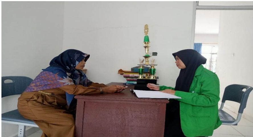
5. Wawancara dengan Guru PAI SMP IT Al-Hijrah Bintuju