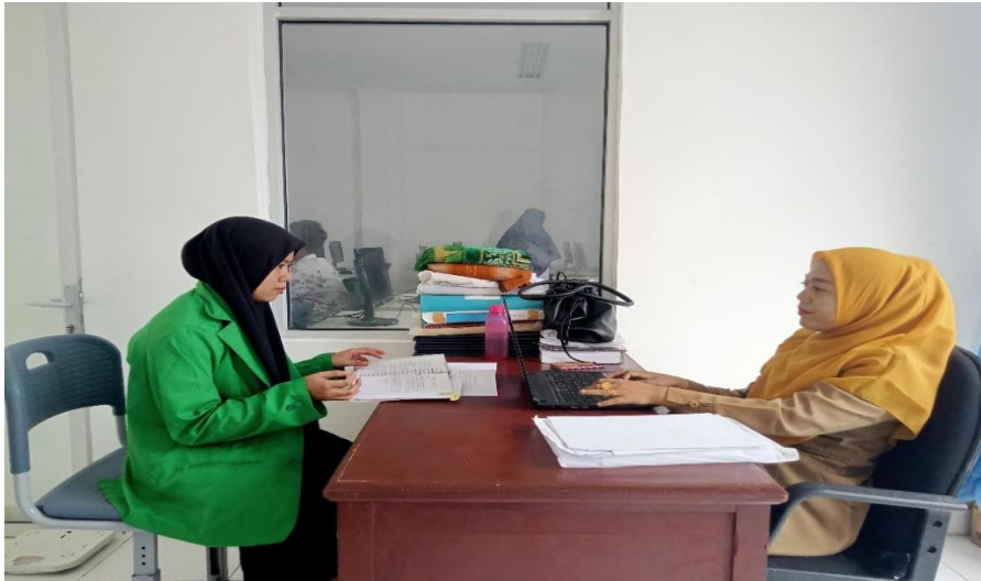
4. Wawancara dengan Kepala Sekolah SMP IT Al-Hijrah Bintuju