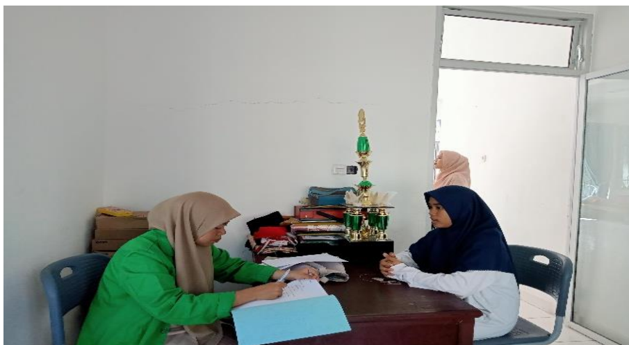
6. Wawancara dengan Siswa SMP IT Al-Hijrah Bintuju