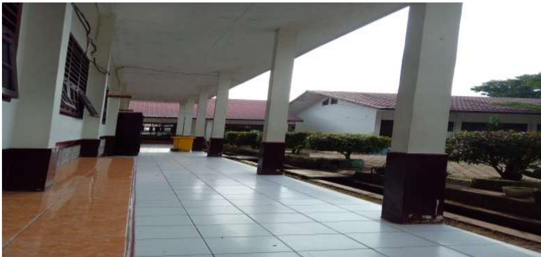
Gambar 6 Dokumentasi Gedung Sekolah