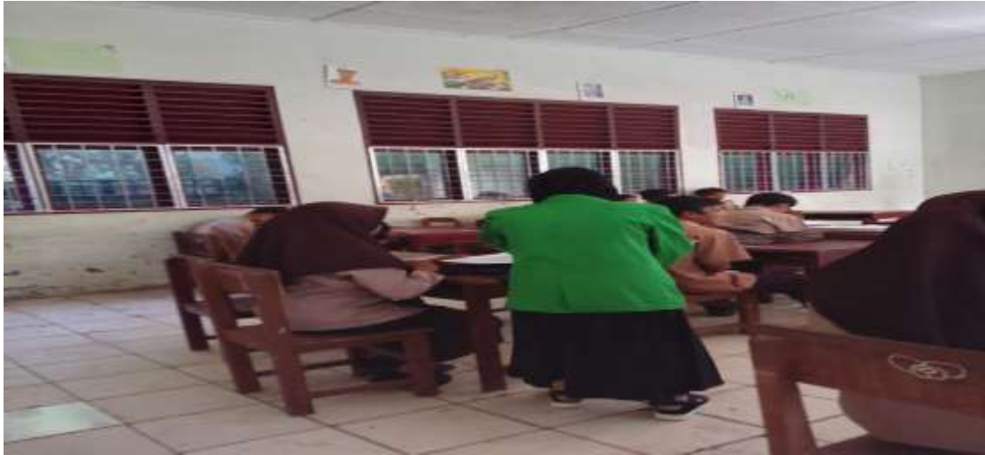
Gambar 3 Dokumentasi Membagikan Angket Penelitian