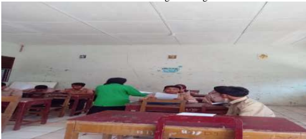
Gambar 2 Dokumentasi Membagikan Angket Penelitian