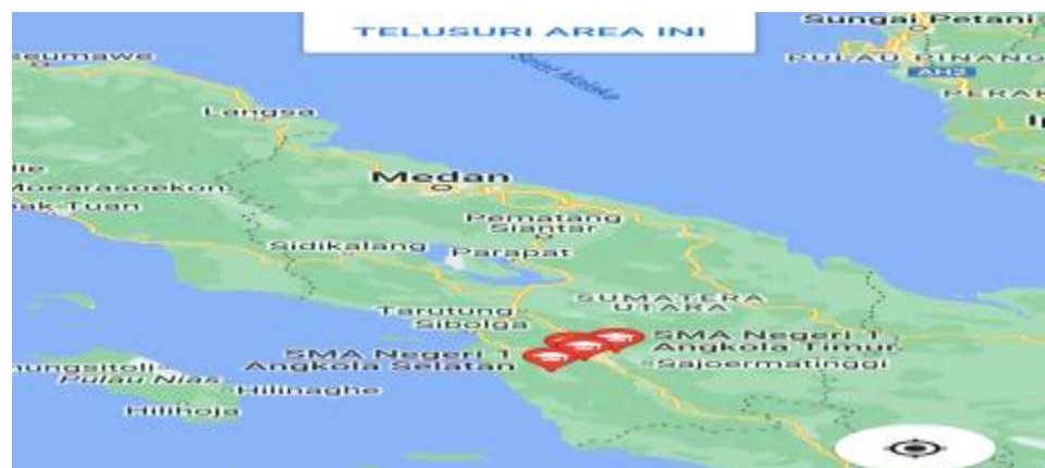
Gambar 3.1 Peta Lokasi SMA N 1 Angkola Selatan