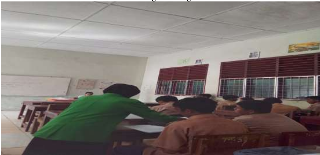
Gambar 4 Dokumentasi Membagikan Angket Penelitian