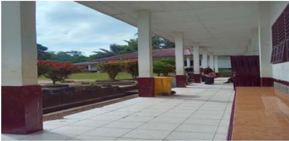
Gambar 1 Dokumentasi Gedung Sekolah