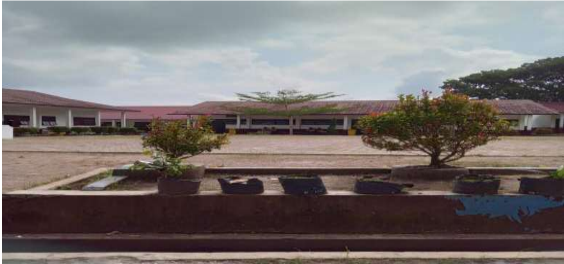
Gambar 5 Dokumentasi Gedung Sekolah