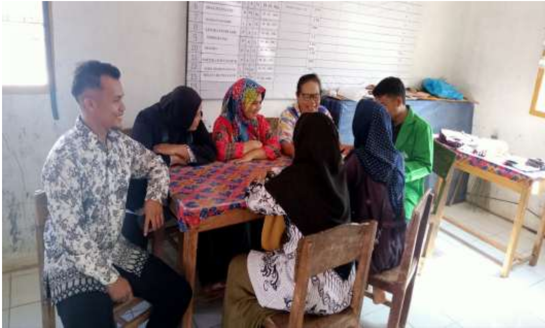
Gambar 4. Wawancara dengan Siswa di Ruang Kelas