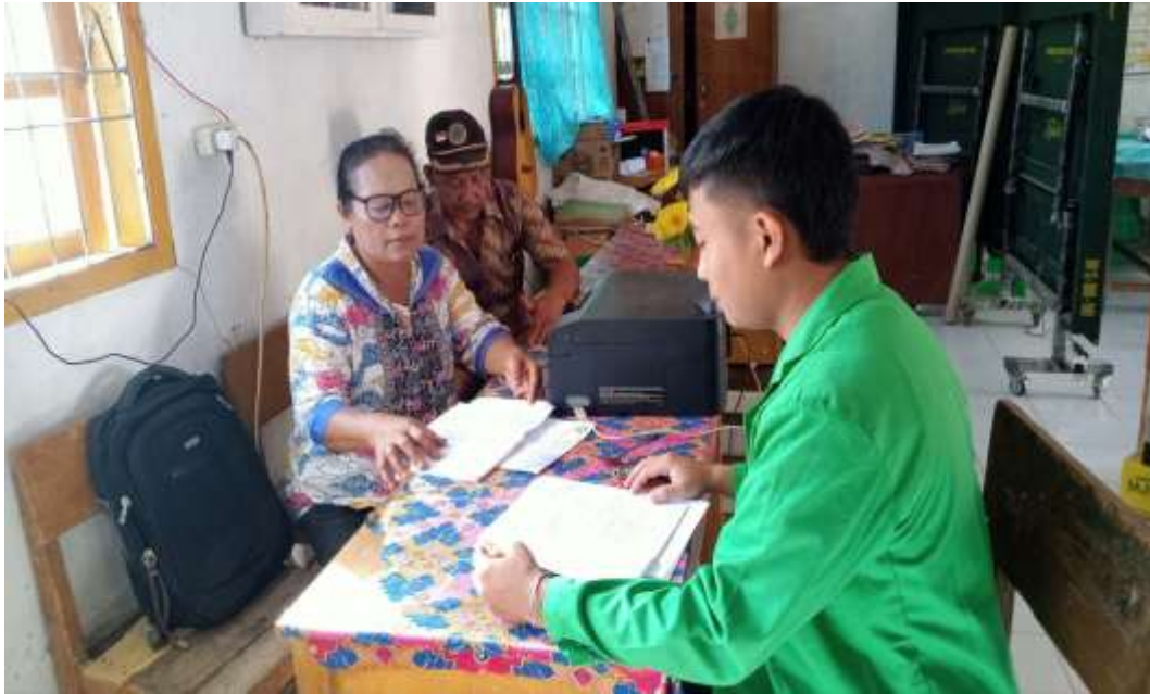
Gambar 3. Wawancara dengan Guru di Kantor Guru