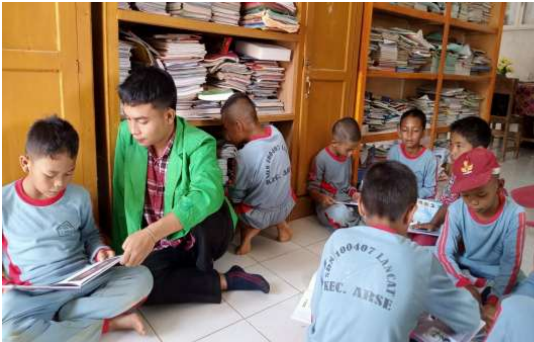
Gambar 6. Wawancara dengan Siswa di Ruang Kelas