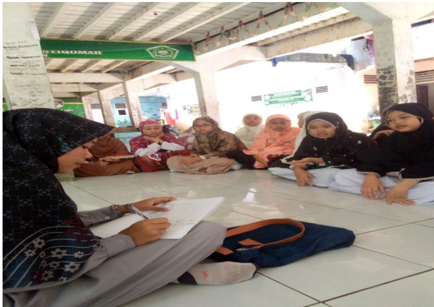
Wawancara dengan Santri Pondok Pesantren Darul Istiqomah Huta Padangsidimpuan