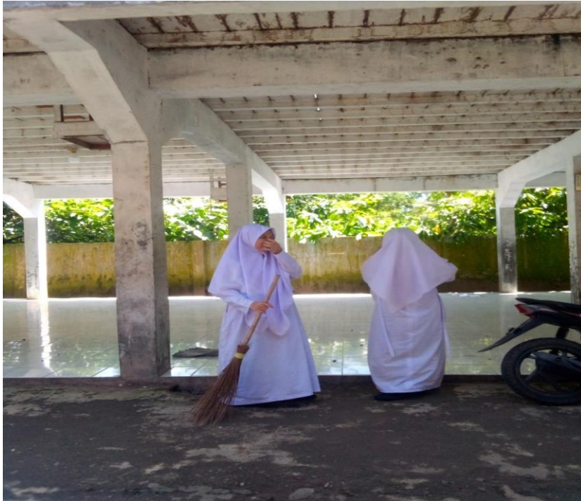
Santri yang mendapat punishment membersihkan lingkungan asrama karena terlambat shalat berjama'ah