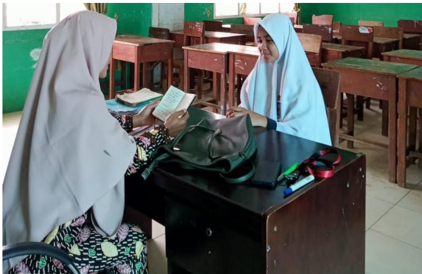
Santri yang mendapat punishment menghafal Al-Qur'an karena terlambat masuk ruangan