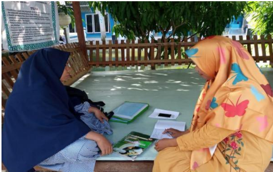
Wawancara dengan guru pembina asrama