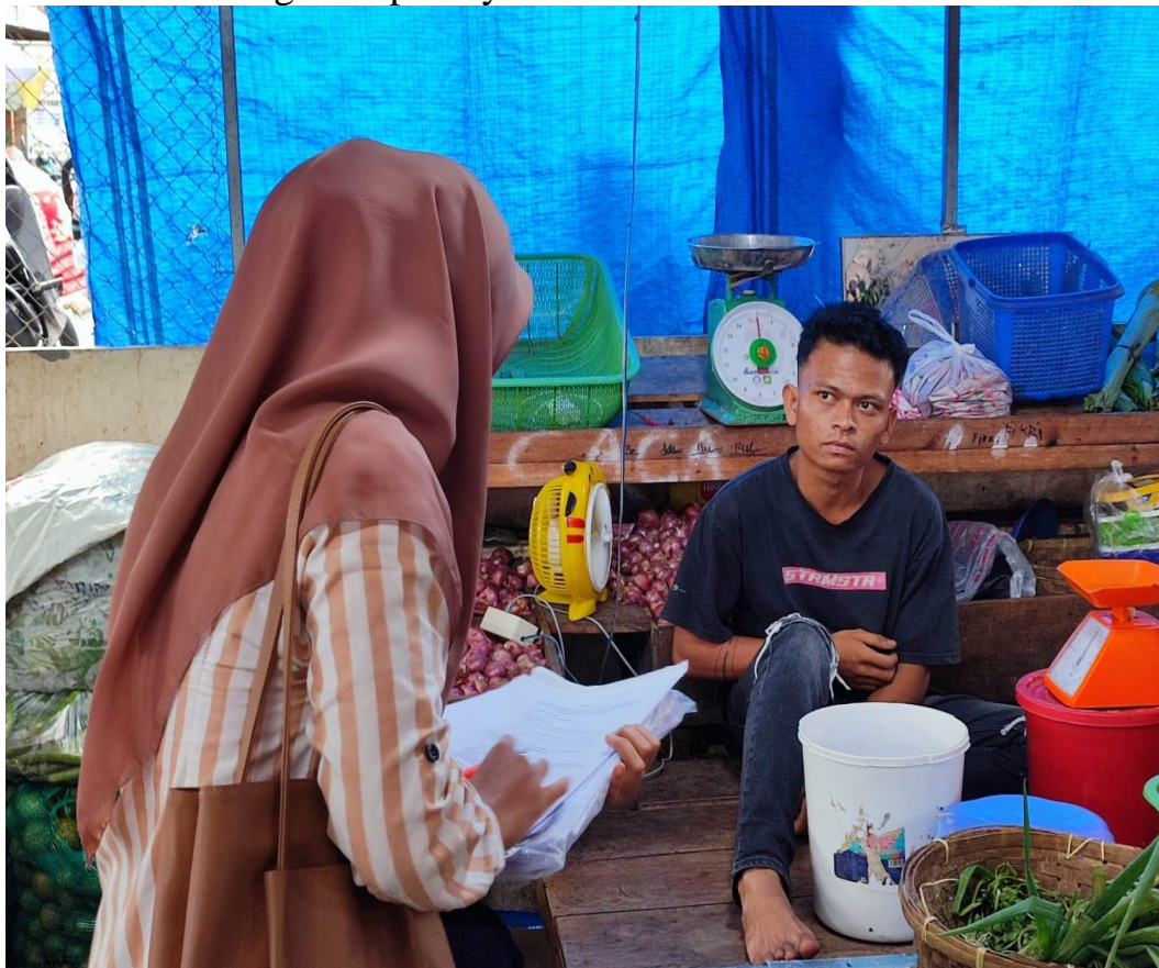
Wawancara Dengan Bapak Absa