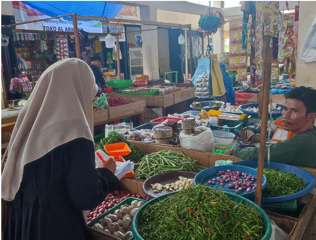
Wawancara Dengan Bapak Edi