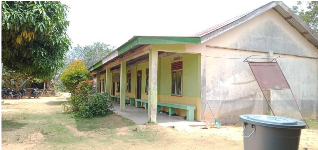
Gambar 2: Gedung permanen Madrasah Tsanawiyah Yayasan Pendidikan Daarul Mukhlisin Bahap