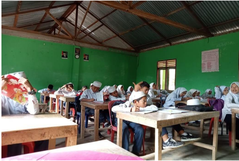
Gambar 3: Observasi di dalam ruang kelas pada saat proses pembelajaran