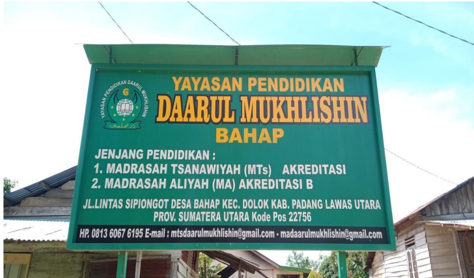
Gambar 1: Gerbang Madrasah Tsanawiyah Yayasan Pendidikan Daarul Mukhlisin Bahap