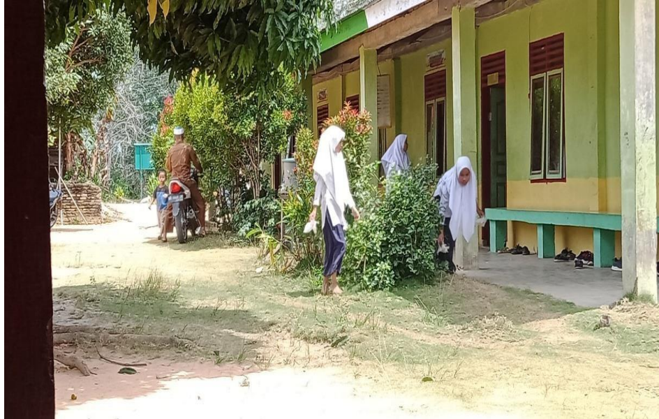
Gambar 4: Observasi di luar kelas pada saat jam istirahat