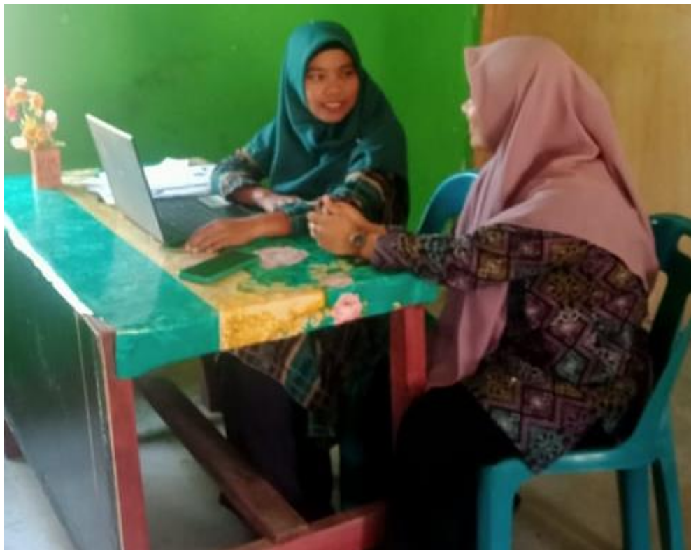
Gambar 6: Wawancara dengan kepala Madrasah Tsanawiyah Yaayasan Pendidikan Daarul Mukhlisin Bahap