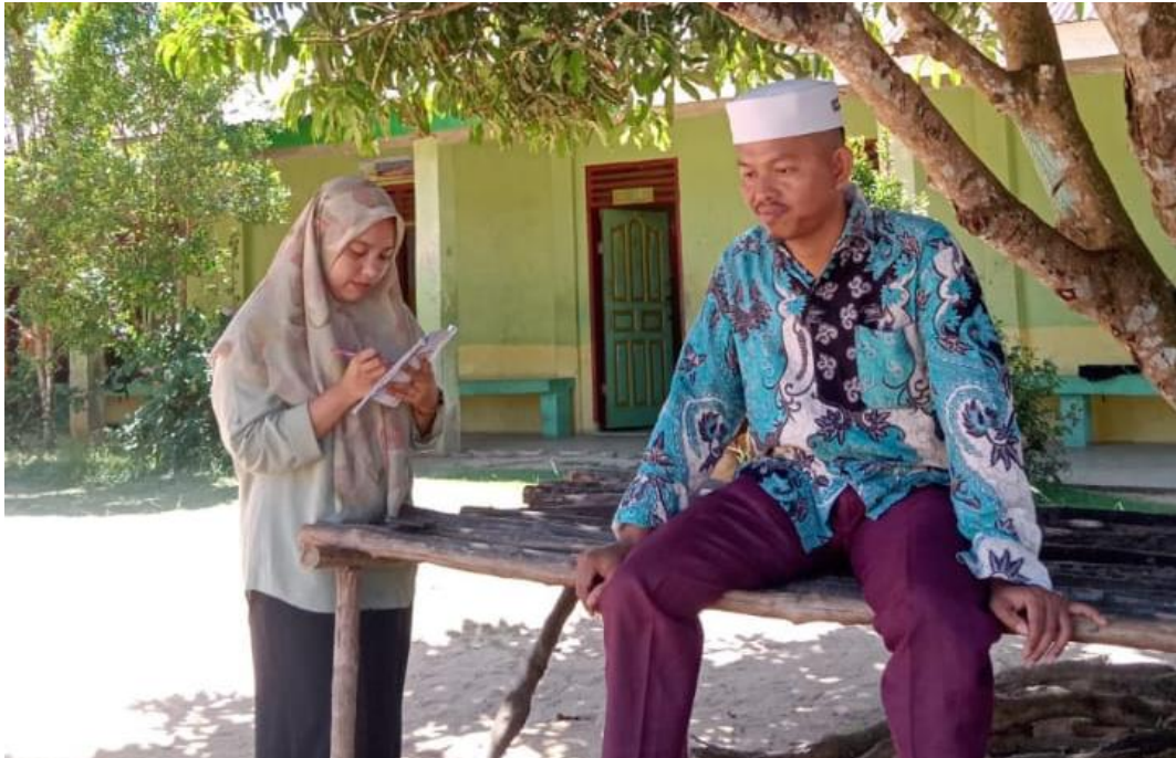
Gambar 5: Wawancara dengan guru Pendidikan Agama Islam di Madrasah Tsanawiyah Yayasan Pendidikan Daarul Mukhlisin Bahap