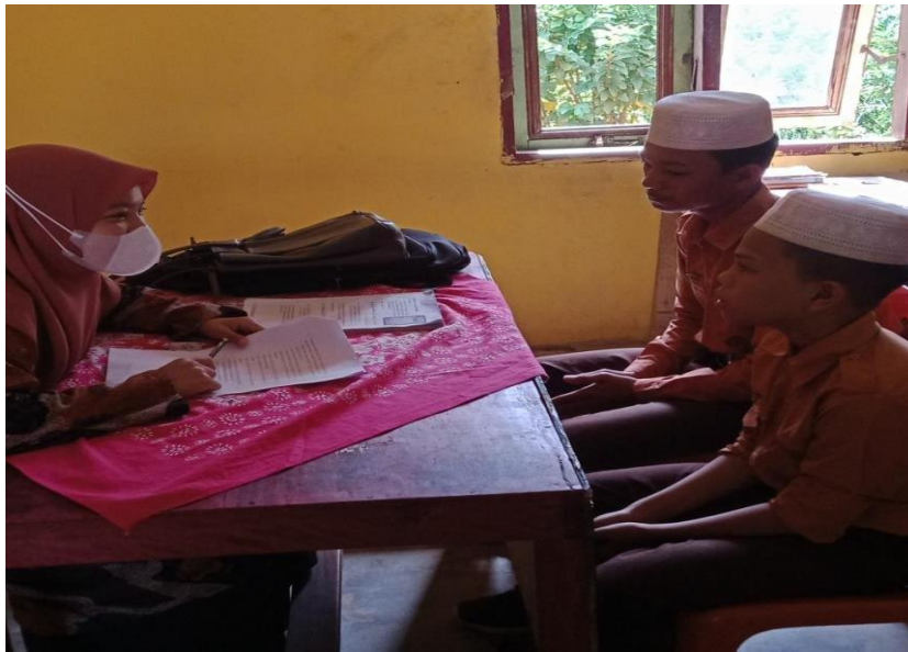
Gambar 7: Wawancara dengan santri kelas VIII Madrasah Tsanawiyah Yaayasan Pendidikan Daarul Mukhlisin Bahap