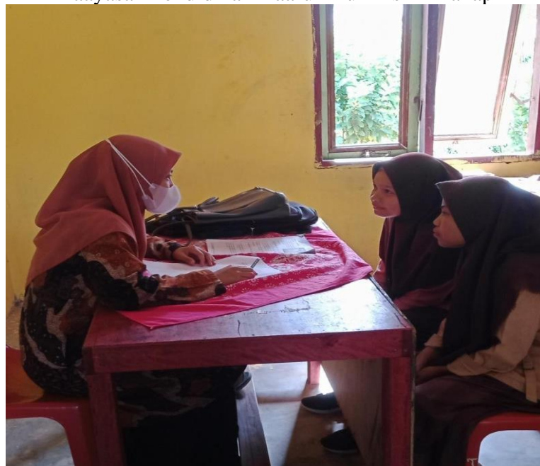
Gambar 8: Wawancara dengan santri kelas VIII Wawancara dengan santri kelas VIII Madrasah Tsanawiyah Yaayasan Pendidikan Daarul Mukhlisin Bahap