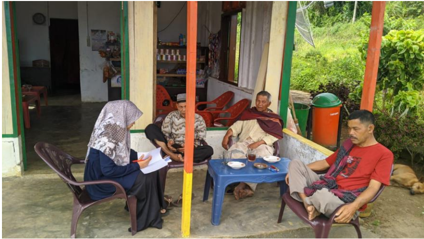
Wawancara bersama bapak kepala Desa