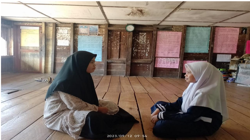
Gambar 4.5 Wawancara dengan Siswa MTs