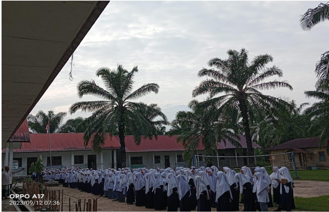
Gambar 4.6 Lokasi Pondok Pesantren Al-mukhtariyah Nagasaribu