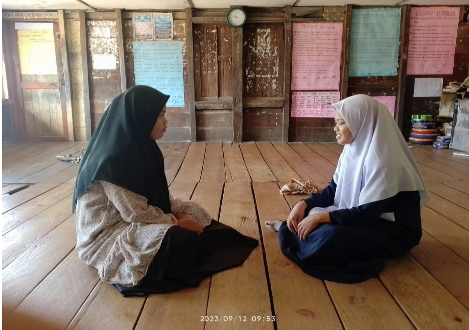
Gambar 4.3 Wawancara dengan Murid MTs