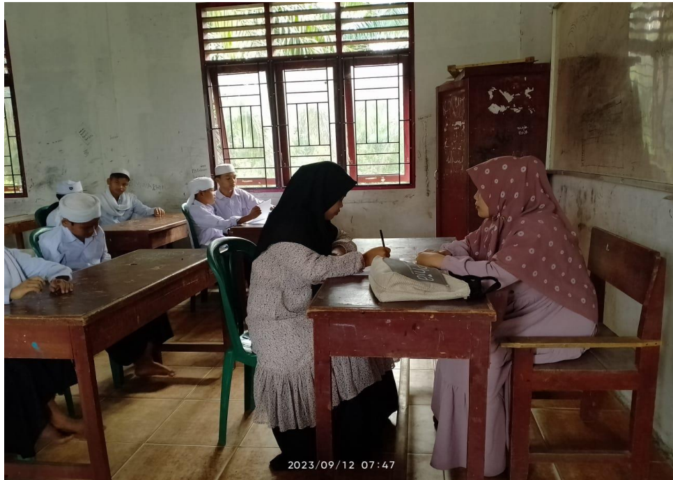
Gambar 4.1 Wawancara dengan Kepala Sekolah