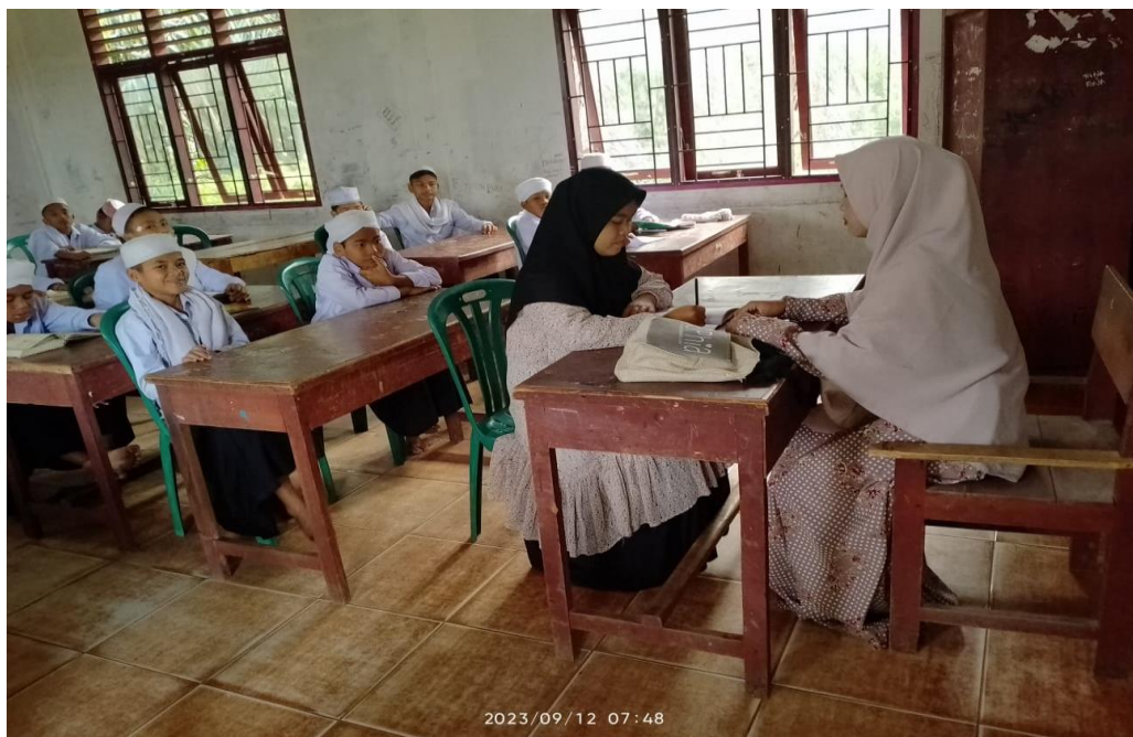
Gambar 4.2 Wawancara dengan Guru Akidah Akhlak