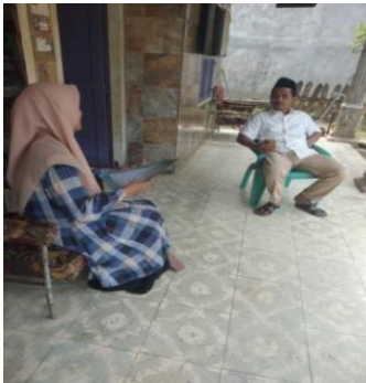
Wawancara dengan Bapak kepdes pada tanggal 03 Agustus 2023.