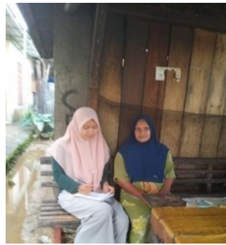
Wawancara dengan ibu kasturi pada tanggal 06 Agustus 2023.