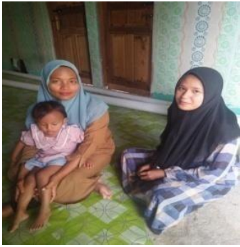
Wawancara dengan ibu guru pada tanggal 14 agustus 2023.