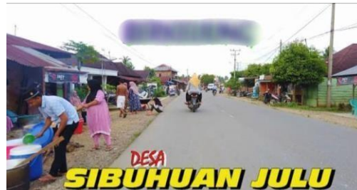
Gambar 1: Foto Desa Sibuhuan Julu Kecamatan Barumun Kabupaten Padang Lawas