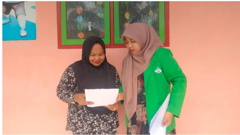
Foto bersama para orang tua pada tanggal 12 November 2023