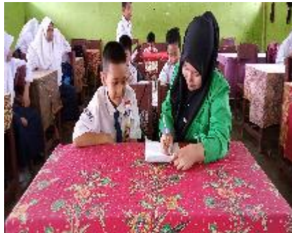
Wawancara dengan MFH mengenai Motivasi belajar PAI