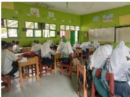
Observasi ketika pelajaran pendidikan agama islam berlangsung