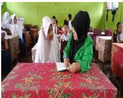
Wawancara dengan RF mengenai kesulitan belajar PAI