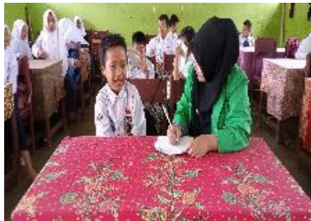
Wawancara dengan NP mengenai Motivasi belajar PAI