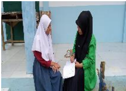
Wawancara dengan TS mengenai kesulitan belajar PAI