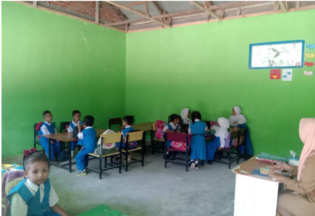
Suasana kegiatan belajar mengajar di kelas kelompok B TK Kasih Ibu Desa Ujung Batu V Kecamatan Hutaraja Tinggi Kabupaten Padang Lawas