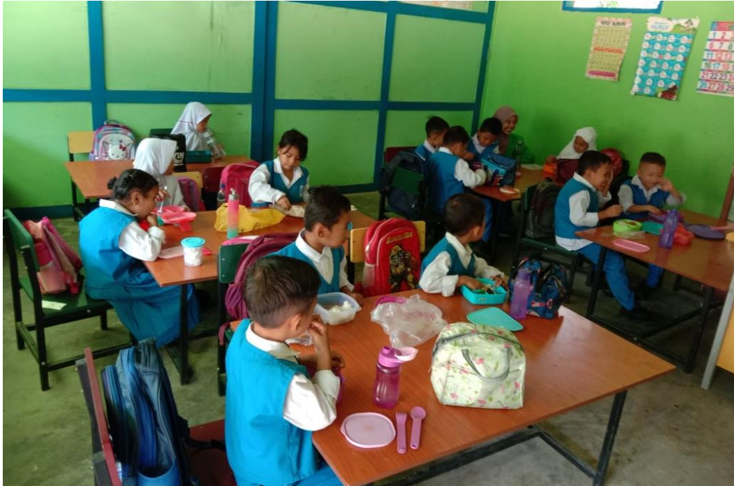
Suasana saat peneliti bermain bersama anak di TK Kasih Ibu Desa Ujung Batu V Kecamatan Hutaraja Tinggi Kabupaten Padang Lawas