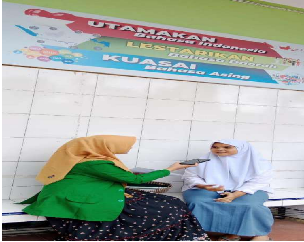
مقابلة مع التلميذة بمدرسة العالية الإسلامية الحكومية ٢ بادانج سديمبوان