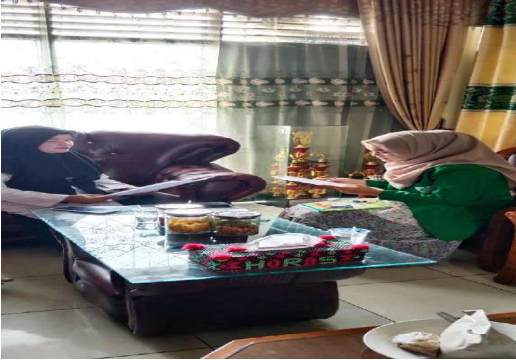
مقابلة مع معلمة اللغة العربية بمدرسة العالية الإسلامية الحكومية ٢ بادانج سديمبوان