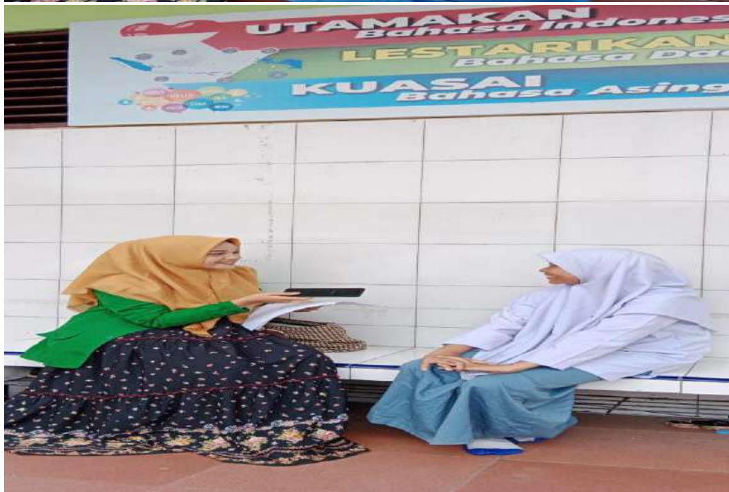
مقابلة مع التلميذة بمدرسة العالية الإسلامية الحكومية ٢ بادانج سديمبوان