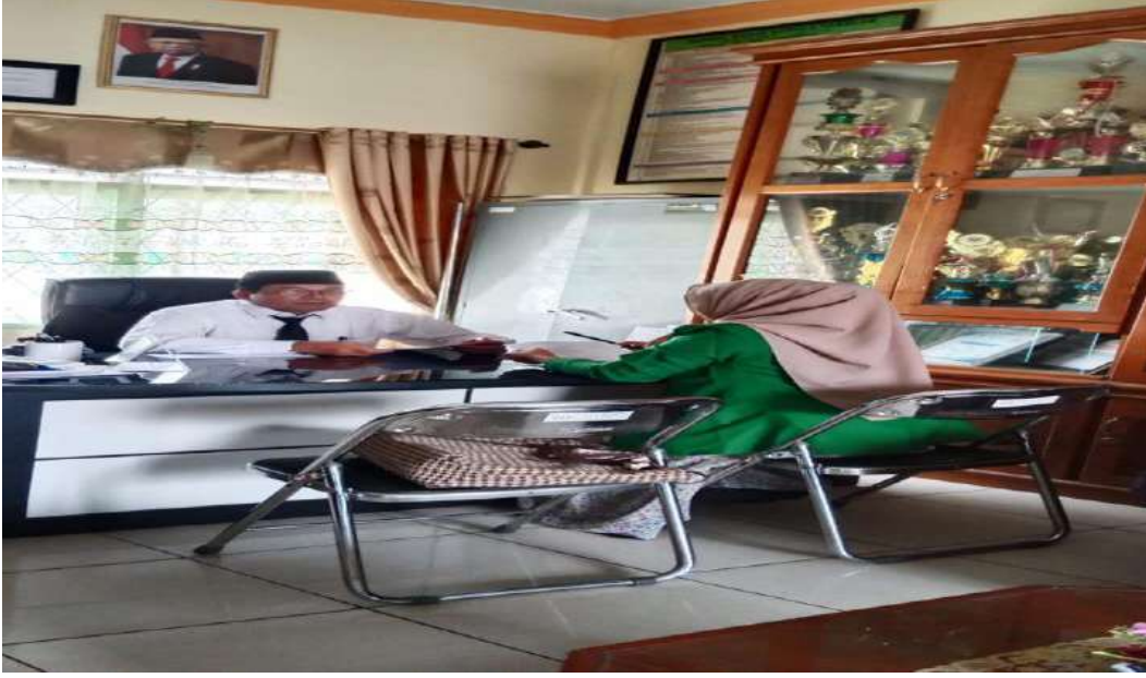
مقابلة مع رئيس المدرسة بمدرسة العالية الإسلامية الحكومية ٢ بادانج سديمبوان